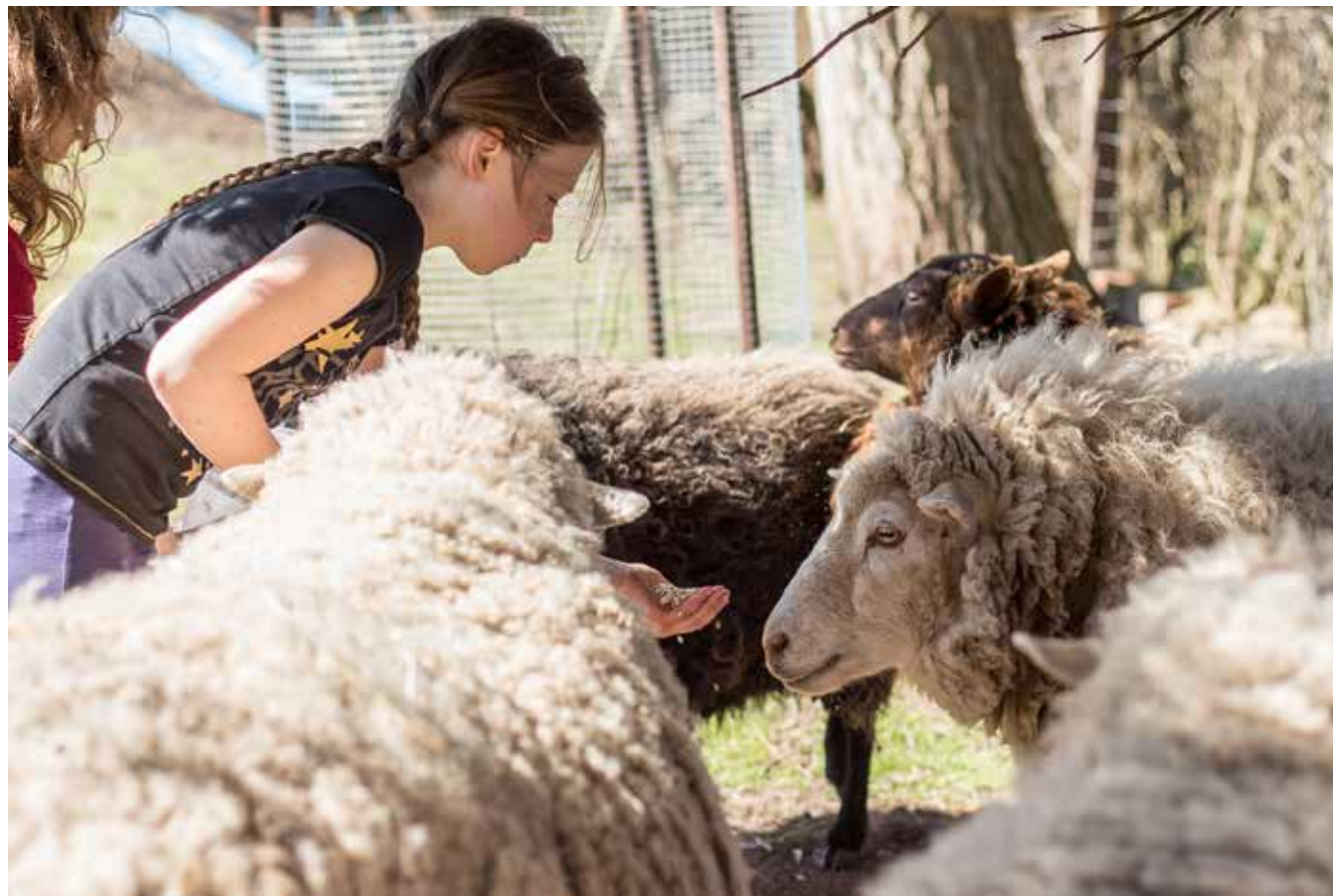
S OVEČKAMI Děti nemají problém pustit ovce z ohrady a hrát si s nimi po celé zahradě. Bezprostřední kontakt s přátelskými domácími zvířaty je skvěle připravuje do života, už odmalá se přirozeně učí odpovědnosti za jinou živou bytost.

vlastně nestojí. Stejně tak nemá smysl nutit je třeba k práci na zahradě, jestli to baví mně, ony mě nechají si ji užívat a samy si klidně najdou program někdy venku, někdy doma. Stačí si najít tu správnou míru rovnováhy. Nechci aby to vyznělo, že jsme venku pořád.