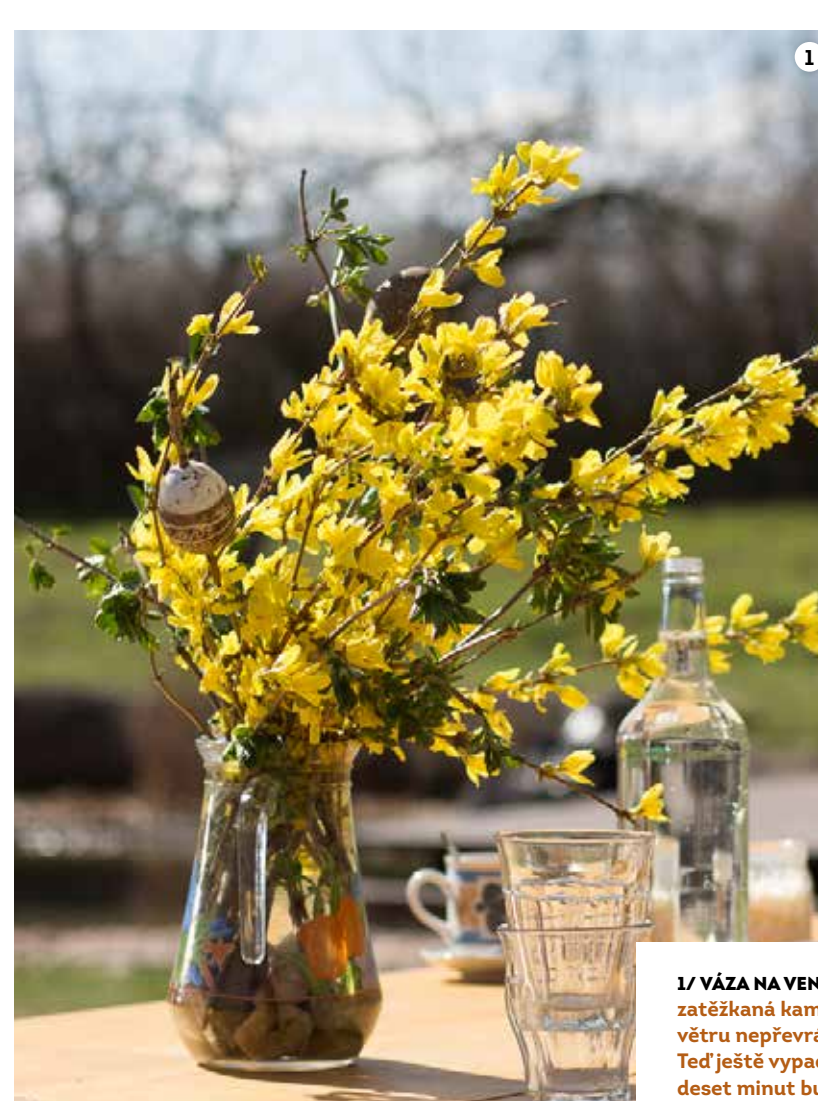
1/ VÁZA NA VENKOVNÍ STŮL Je uvnitř zatěžkaná kameny aby se ani ve větru nepřevrátila. 2/ JEZÍRKO Ted' ještě vypadá opuštěné, ale za deset minut bude plné dětí. 3/ PÍSEK A HOUPAČKA V rodinách, kde se pořád něco stává, mají děti neustálý přísun materiálu na hraní. Písek, cihly, prkna... 4/ SÁRA Ve vysoké trávě může být každý chvíli sám. Sára ráda staví obří hnízda.

Justina: S manželem jsme se potkali ve Vzdělávacím centru Tereza, kde on pracoval po vysoké škole na civilní službě. Původně uvažoval o vědecké dráze, ale v Tereze může ovlivňovat praxi rychleji nejen v rámci ekologické výchovy, ale i v tématech dětí venku. Pro toto téma napsal publikaci Děti venku, ohrožený druh?, která shrnuje přínosy