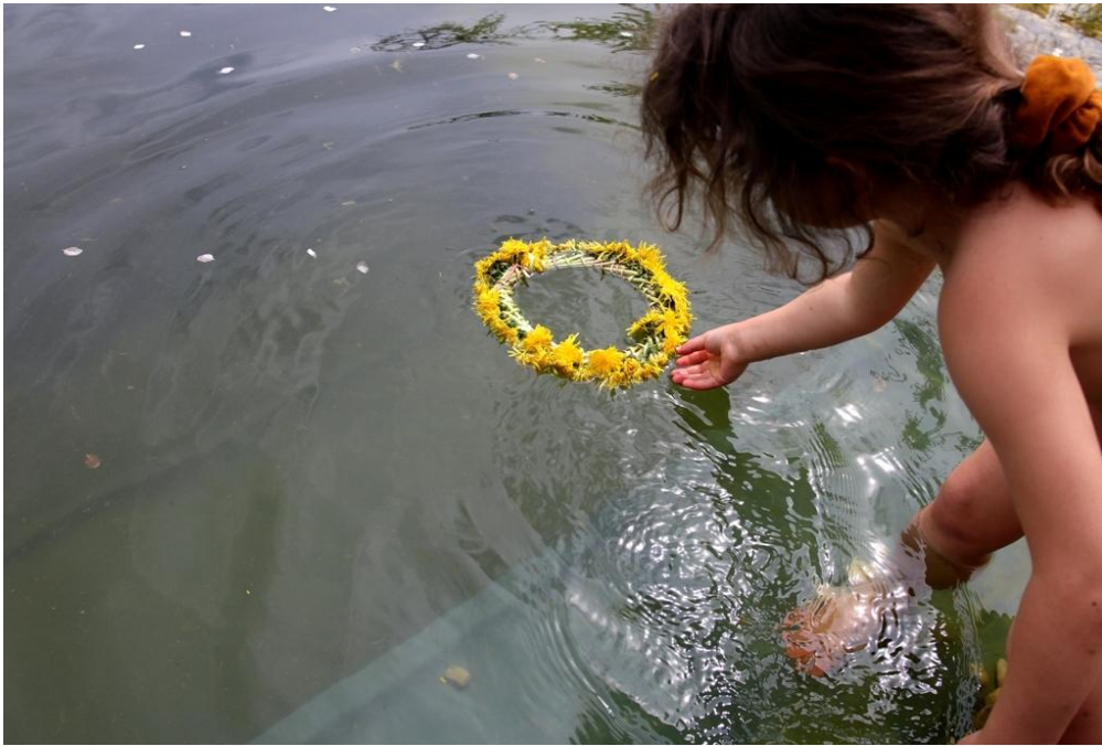
VĚNEČKY VE VODĚ